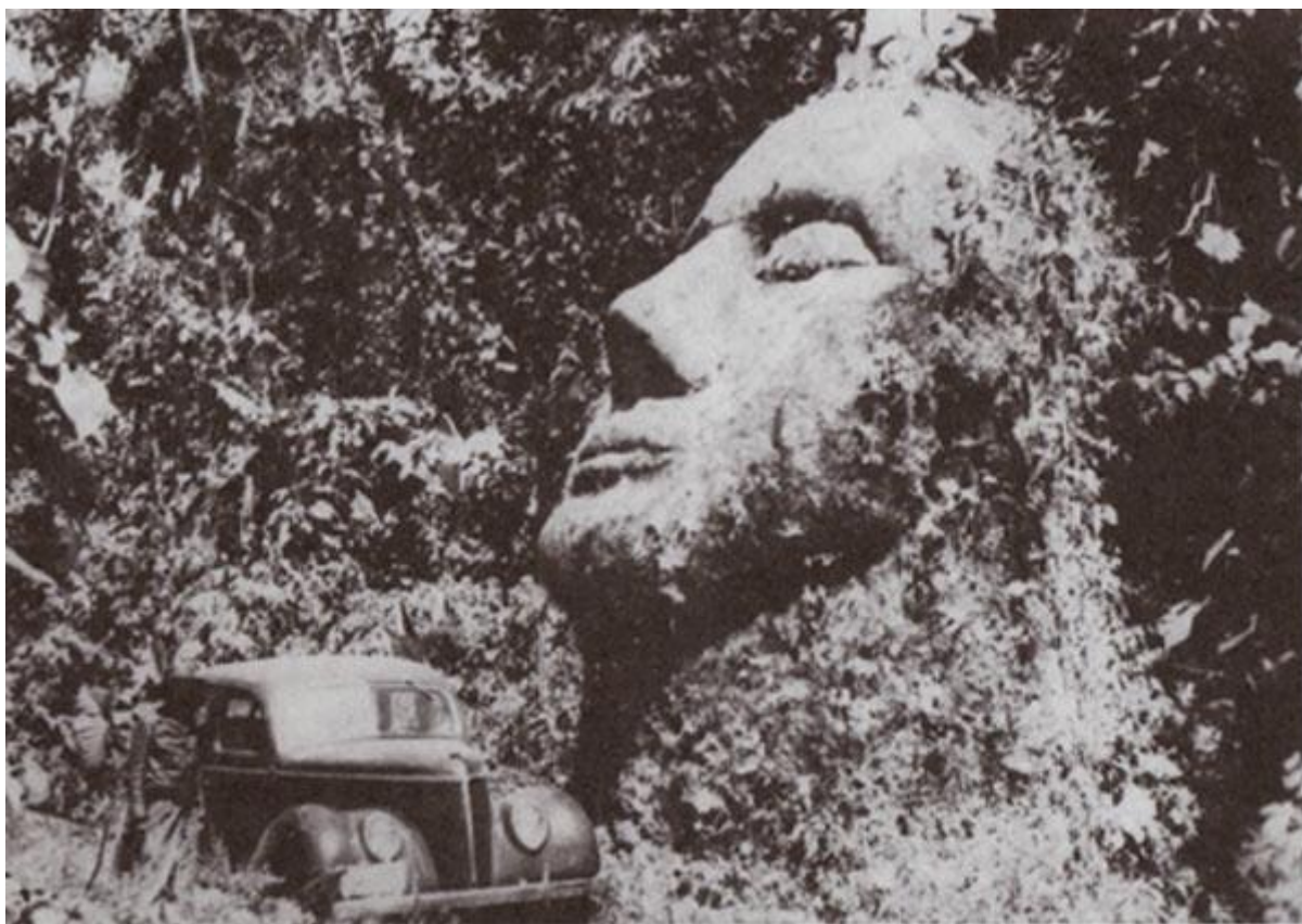
Гигантская каменная голова в Гватемале. Фото 1950-х годов.

Полвека назад, глубоко в джунглях Гватемалы была обнаружена гигантская каменная голова. Повёрнутое к небу лицо имело большие глаза, тонкие губы и большой нос. Необычно то, что это лицо кавказского типа не соответствует ни одной из доиспанских рас Америки. Открытие быстро привлекло к себе внимание, но так же быстро исчезло со страниц истории.