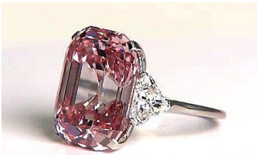
Рекорд: Самый дорогой драгоценный камень из когда-либо проданных на аукционе

Одними из самых высоко ценимых драгоценных камней в мире являются цветные бриллианты, которым была дана оценка (D) и которые не имеют недостатков. Один из таких бриллиантов был обнаружен в 1950-х годах, когда американский ювелир Гарри Винстон (Harry Winston) купил редкий розовый бриллиант у неизвестного коллекционера. Размер бриллианта составлял 24.78 карата. Винстон описывал его как «один из величайших бриллиантов из когда-либо обнаруженных». Он был классифицирован Геммологическим институтом Америки как «фантастический тёмно розовый бриллиант», что само по себе является очень высокой оценкой цвета. Этот драгоценный камень был также оценён как бриллиант Типа IIa, что помогло ему войти в 2% самых лучших бриллиантов в мире. Ему была придана прямоугольная форма с закруглёнными краями, и он был инкрустирован в кольцо.