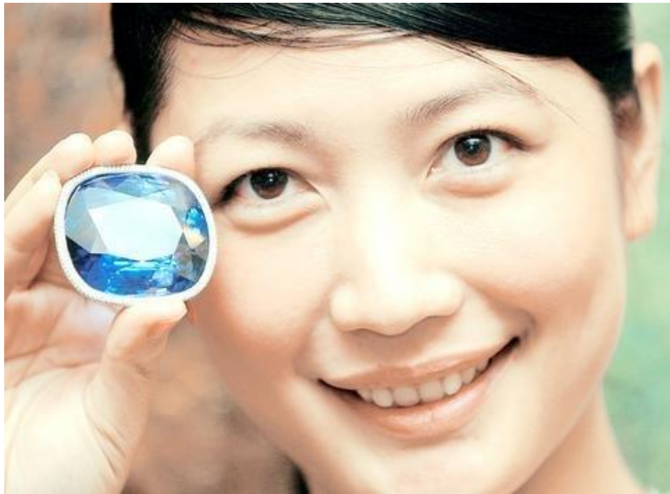
Рекорд: Крупнейший гранёный голубой сапфир в мире .

В 1907 году у вершины горы Пик Адама (Adams Peak), Шри-Ланка, был обнаружен замечательный огромный синий сапфир. Это было невероятным событием, так как синий цвет является одним из самых редких цветов сапфира на планете. Впоследствии сапфир был обработан и отполирован в Голубой Гигант Востока. По данным тех лет, сапфир весил 466 карат, и соответственно стал крупнейшим ограненным синим сапфиром в мире.