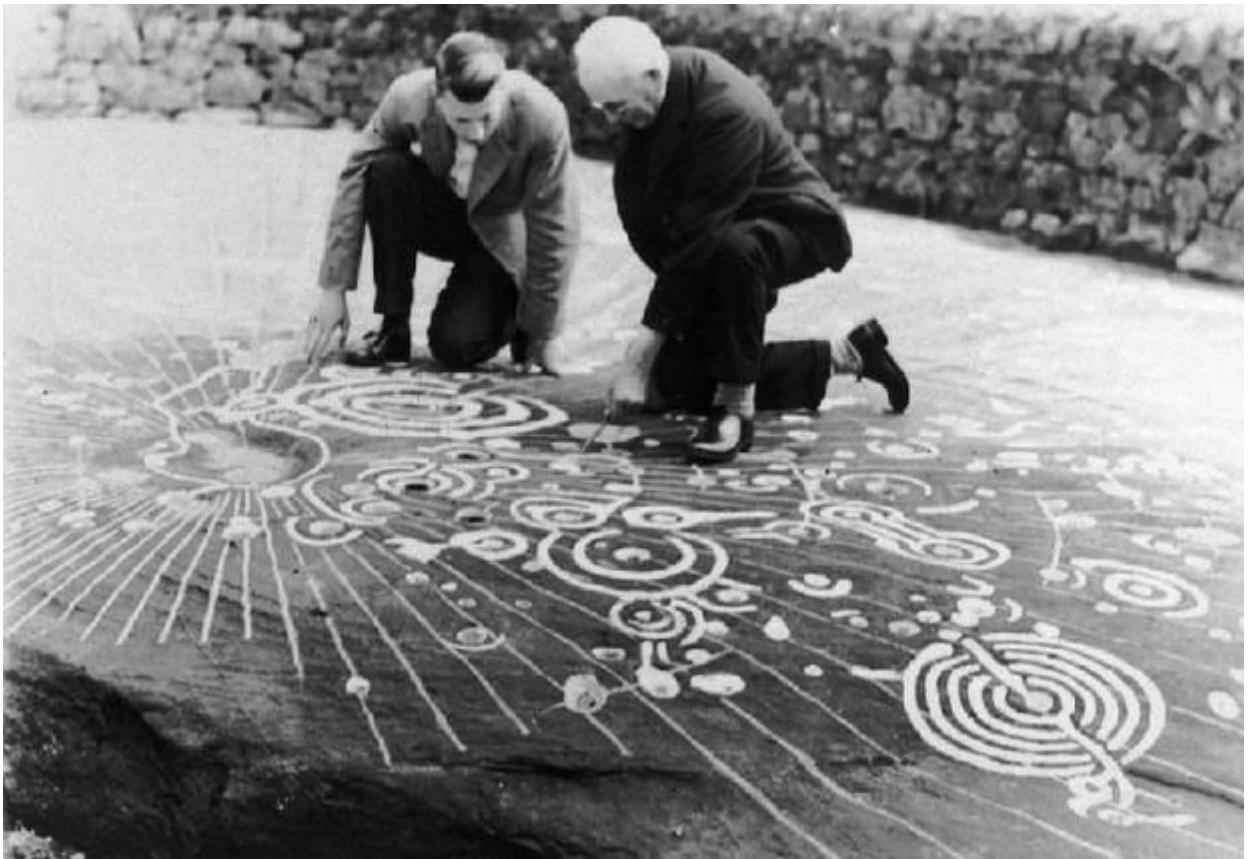
В целом картина напоминает некую схему